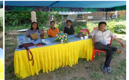
สอดคล้องกับยุทธศาสตร์การ